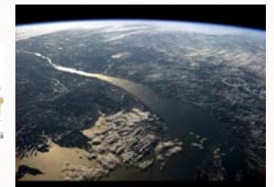
Des cellules à l'optique en passant par les fluides.