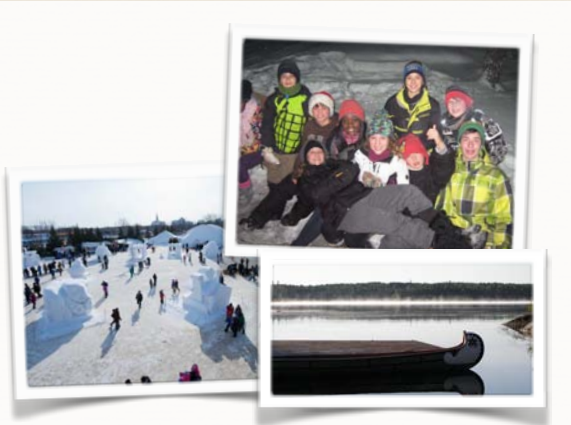
Une vie étudiante qui carbure à la culture francophone dans les praires riches en histoire!

Les élèves de l'école Précieux-Sang jouissent d'une éducation qui se distingue par sa culture francophone et métis. Ils font partie d'une division scolaire, la DSFM, qui est autonome et qui gère plus de 20 écoles éparpillées dans la province du Manitoba. Le caractère propre de la francophonie apporte une richesse linguistique et culturelle hors du commun dans un contexte où l'apprenant sera outillé pour répondre aux besoins d'une société canadienne en perpétuels changements.