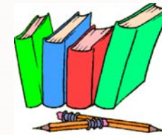
Écriture et lecture au rendez-vous!

La littérature jeunesse est un incontournable et les élèves de la huitième année doivent se préparer pour intégrer les compétences en lecture et écriture pour les années du secondaire. De plus, l'expression orale est un domaine de pratique fréquent et renforcé en 8 e année.