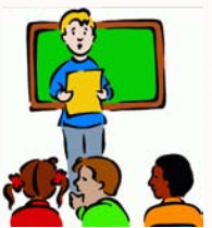
L'expression orale et l'écoute est l'ordre du jour!